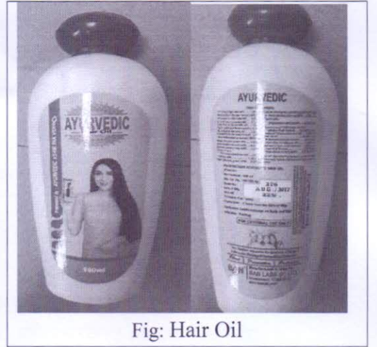
Fig: Hair Oil

"Bhringraj (eclipta alba), Manduka Parni (bacopa monnieri), Jati, Gunja, Sydha Dhatura, Elayehi, Nili, Indravaruni, Jatamansi, Katranj, Neem, Triphala, Rasot, Vacha, Milk, Godhuma (triticum sativum) oil, Nili oil, Til (sesamum indieura) oil, Lemon (Citrus media) oil, Narivala (coeos nueiiera) oil."